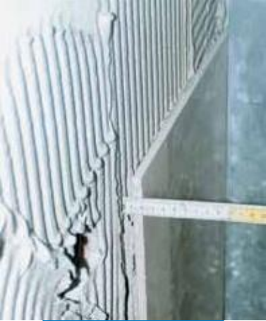
Porcelanato aplicado en pared