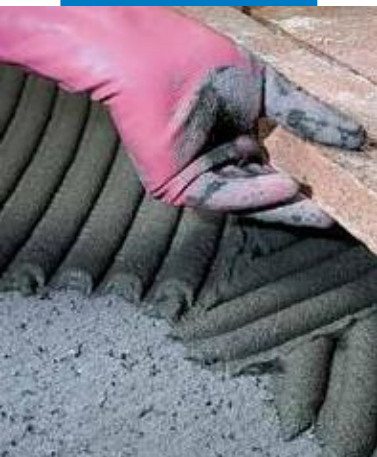
Colocación de barro cocido hecho a mano sobre contrapiso rugoso