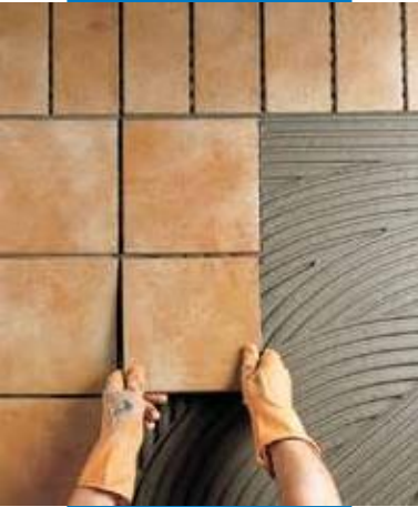
Colocación de klinker en el exterior