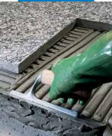
Colocación de placas con relieve acusado en el exterior